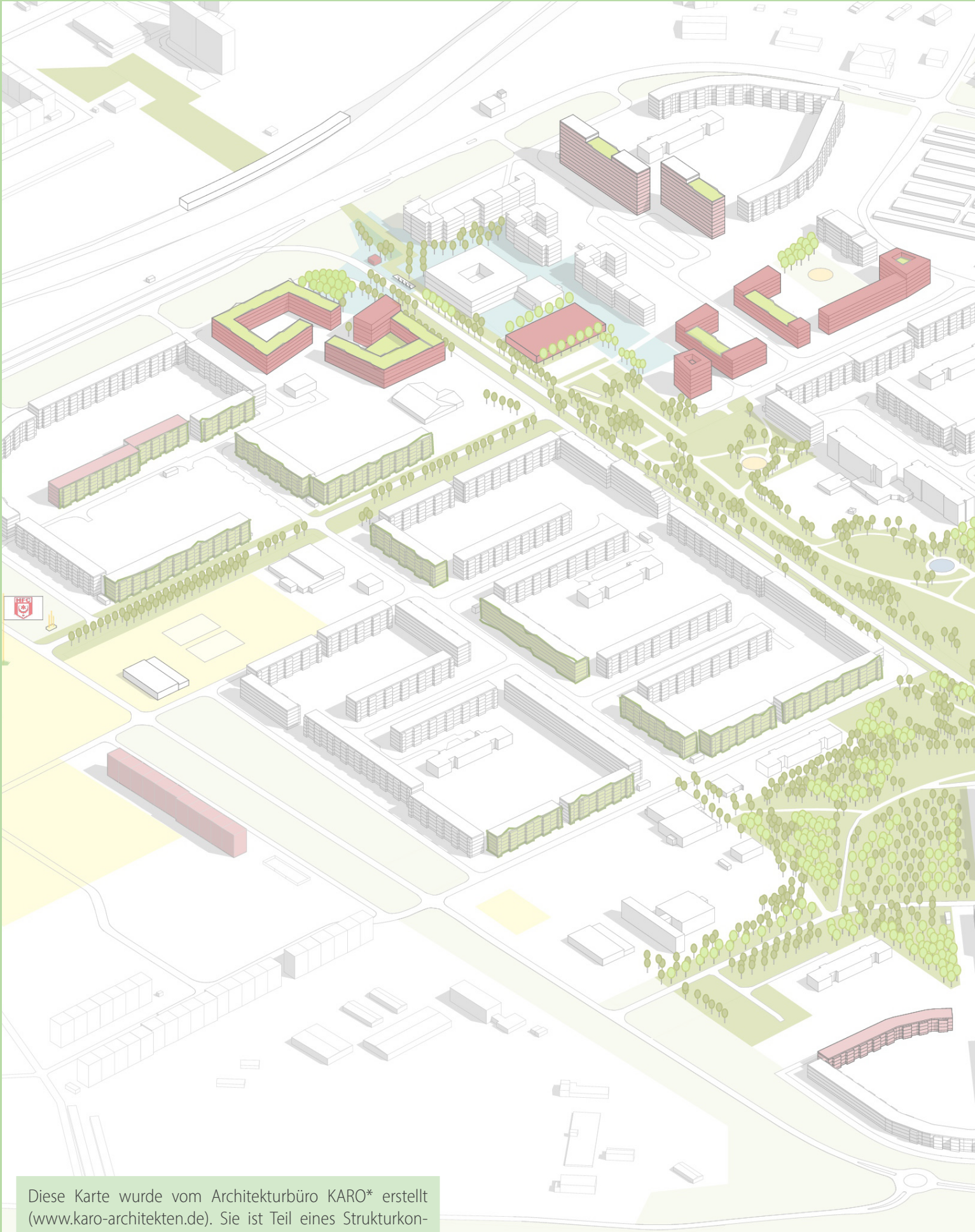
Diese Karte wurde vom Architekturbüro KARO* erstellt ( www.karo-architekten.de ). Sie ist Teil eines Strukturkonzepts für die Silberhöhe und zeigt potentielle bauliche Entwicklungen im Quartier.