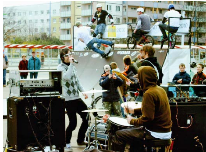
Abb. 3: Rollsportler stellen sich den Halle-Neustädtern vor

Das Image Halle-Neustadts hat einen bemerkenswerten Aufschwung erhalten. Der nachhaltige und immer noch andauernde Einsatz der Jugendlichen für ihren Park wird belohnt. Er macht Furore und neugierige, interessierte und sportbegeisterte Menschen kommen in die Neustadt. Natürlich beleben sie das Stadtteilzentrum – und damit ist eines der Ziele der Stadtplanung erreicht. Viel wichtiger ist aber: Sie kommen in die Neustadt, sie lernen den Stadtteil kennen, sie haben die Möglichkeit, ihre Vorurteile bestätigt zu finden oder diese zu revidieren. Sie setzen sich mit dem Stadtteil auseinander, nehmen ihn wahr und prägen ihn mit. Neue Potenziale, neue Ideen, frischer Wind, ein Klima des Aufwachens – all das findet man nun in Halle-Neustadt.